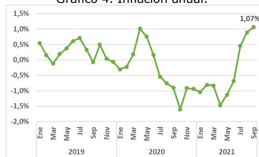
Gráfico 4. Inflación anual.

La inflación anual a partir de julio de este año, revierte la tendencia a la deflación que se presentó desde julio de 2020 a junio de 2021, pues la inflación anual fue negativa con un promedio de -0,97% (ver gráfico 4).